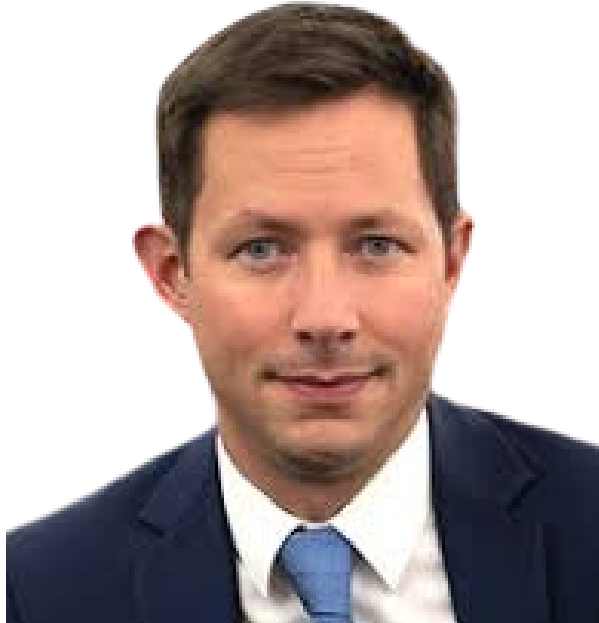
François-Xavier Bellamy-Tête de liste