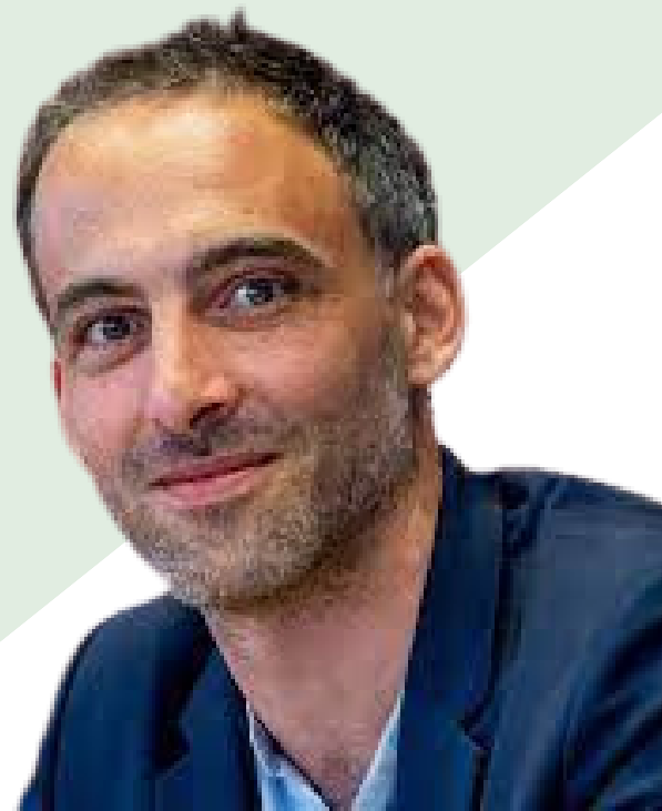
Raphaël Glücksmann - Tête de liste