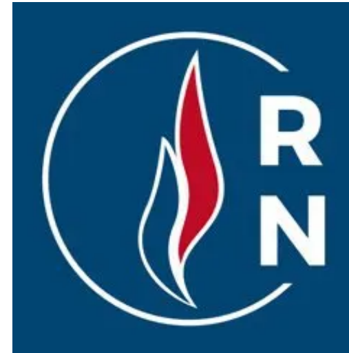
Jordan Bardella - Tête de liste