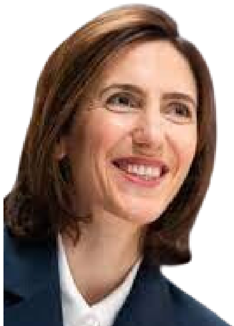
Valérie Hayer - Tête de liste