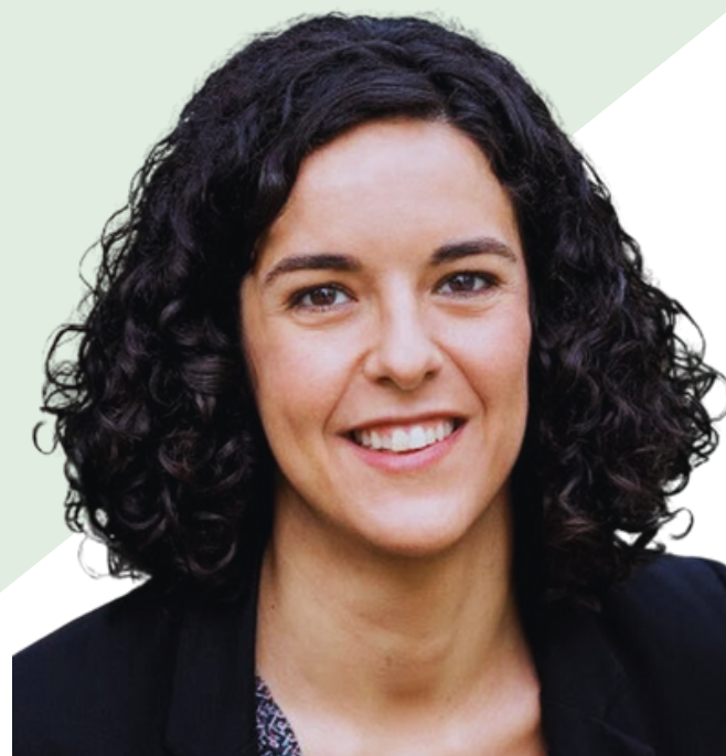
Manon Aubry - Tête de liste